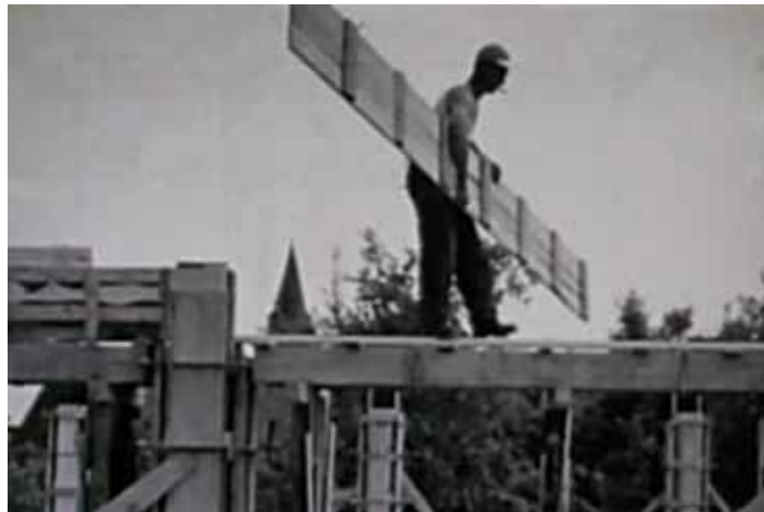
Aufnahme von den Arbeiten am Rohbau des Gemeindehauses 1961. Im Hintergrund ist der Turm der alten Martinskirche erkennbar. Das Foto stammt aus der Ortsrundschaue 1963 der Schmalfilmfreunde Rivoesch.

Unser Gemeindehaus in der Schubertstraße wurde 1962 gebaut und ist jetzt in die Jahre gekommen. Nach fast 50 Jahren ist in einigen Bereichen eine Sanierung erforderlich. Die ständig steigenden Energiekosten belasten unseren Haushalt und der hohe Energieverbrauch ist ökologisch nicht mehr vertretbar. Besonders die Wärmedämmung des Gebäudes muss daher dringend verbessert werden.