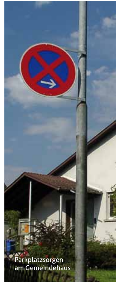
Parkplatzsorgen am Gemeindehaus

Günter Kröck, Günter Rinn Bauausschuss des Kirchenvorstands