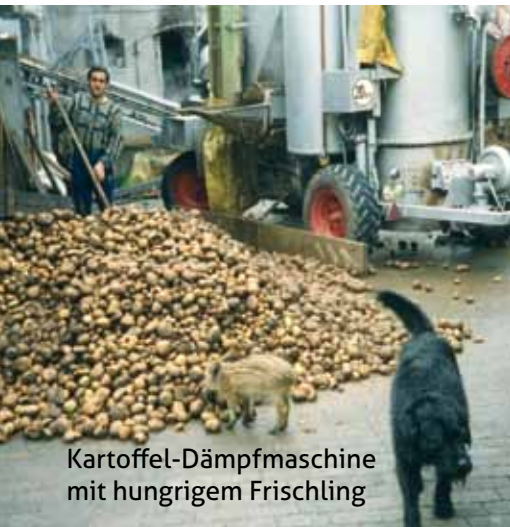
Kartoffel-Dämpfmaschine mit hungrigem Frischling

Noch 1950 bildete für über 70 Haushalte in Heuchelheim die Landwirtschaft die Lebensgrundlage, während die Arbeit im Handwerk, bei Rinn & Cloos, Minox, Schunk & Ebe oder im eigenen Geschäft das Auskommen vervollständigte. Diese Nebenerwerbslandwirte bestellten große Nutzgärten und einen oder mehrere Äcker, um sich von den Erträgen zu ernähren. Als Tiere wurden hauptsächlich Rinder, Ziegen, Kaninchen, Geflügel und ein Schwein für die Hausschlachtung gehalten.